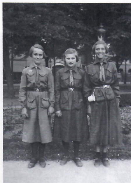
På scoutmöte i Stockholm 1936