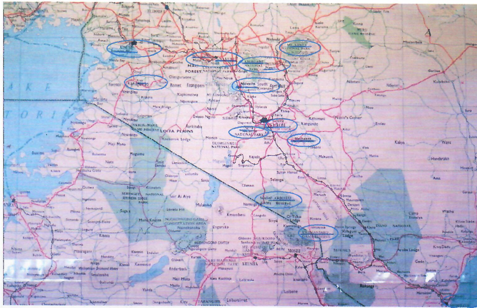
Bild 2 Nairobi centrum