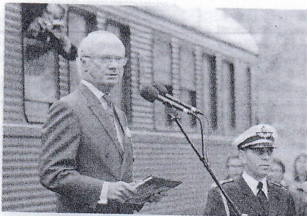
– Det gick undan värre 1902 när min förfader Oscar II inte fick möjligheter att stanna här.