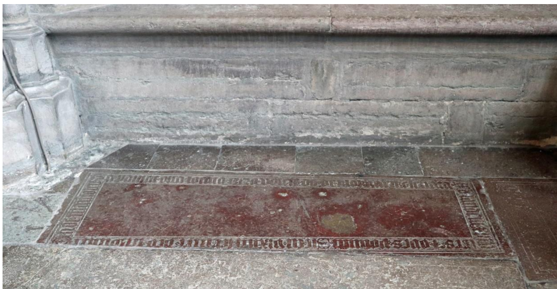
S:t Björns grav i Niklas-koret i Linköpings domkyrka