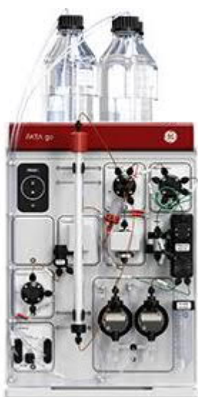
kromatografisystem ÄKTA Go