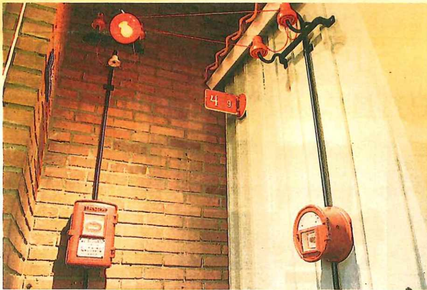
► Det vänstra brandskåpet är från 1930-talet och det högra från 1900-talets början. Båda har varit placerade i Linköping.