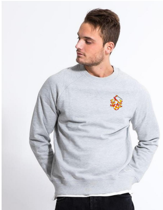
Premium Sweater Stl: L, M, S