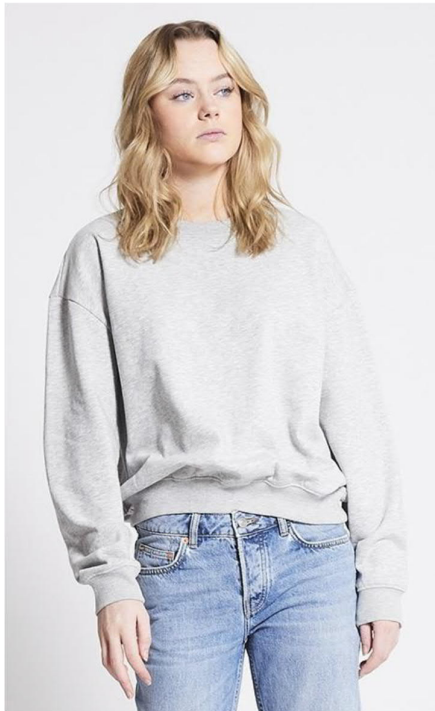
Tröja New Crew Stl: XL, L, M, S